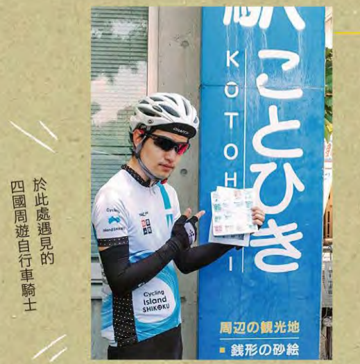
道之驛 琴彈 MAP-B-5