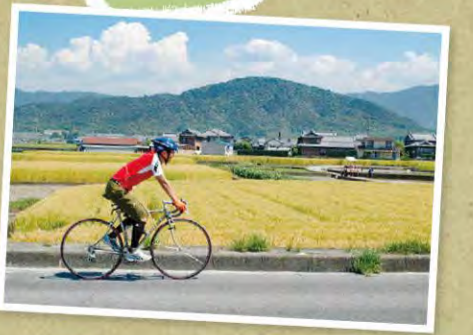
4月到5月期間可見 閃耀耀光輝的金色麥田