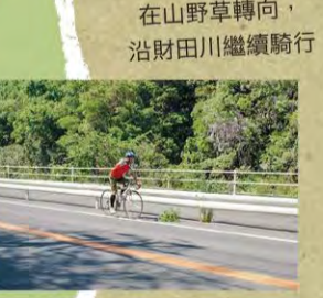
在山野草轉向，沿財田川繼續騎行