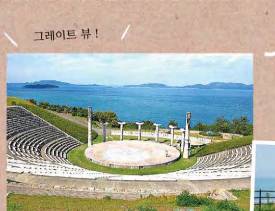
오쿠시 자연공원 MAP D-2