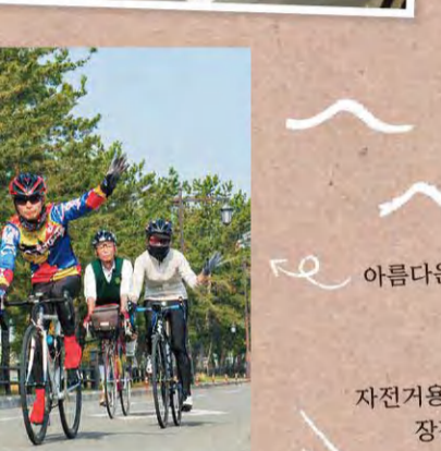
시로토리노마쓰바라 MAP G-4