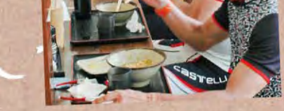
달리기 편한 와인 로드 MAP D-2