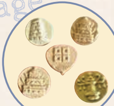
飄散著讚岐三盆糖輕柔甜味的 和三盆菓子