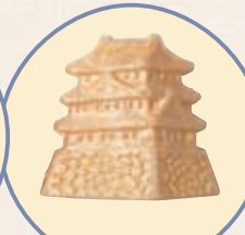
令人不禁想裝飾起來的最中餅 和菓子