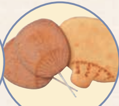
美味的團扇 團扇系列