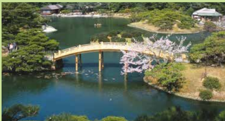
리쓰린 공원 MAP C-5

가가와현은 많은 골프장과 함께 많은 관광지가 있습니다. 일본의 작은 현이므로 콤팩트하게 관광지를 둘러볼 수가 있습니다.