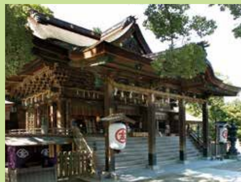
고토히라구 신사 MAP E-2