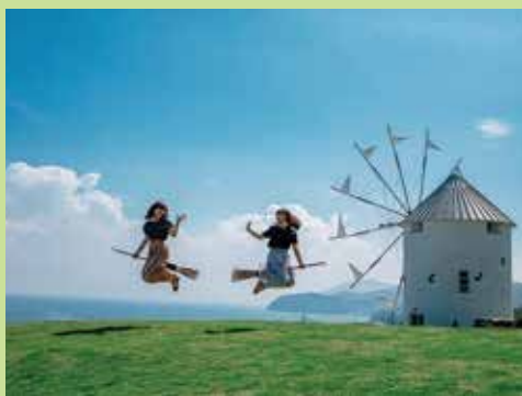
쇼도지마 올리브공원 MAP B-7