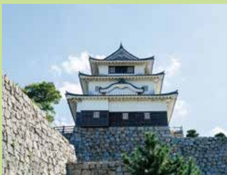
마루가메성 MAP C-2