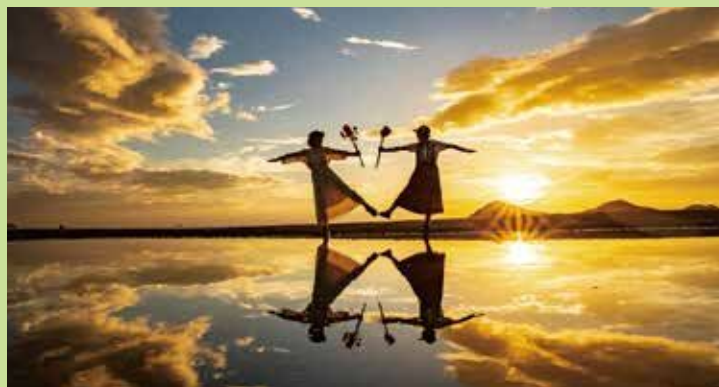
지치부가하마 해변 MAP E-1